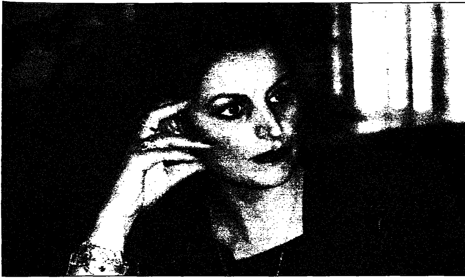
خدوجة صبري (القدس العربي)